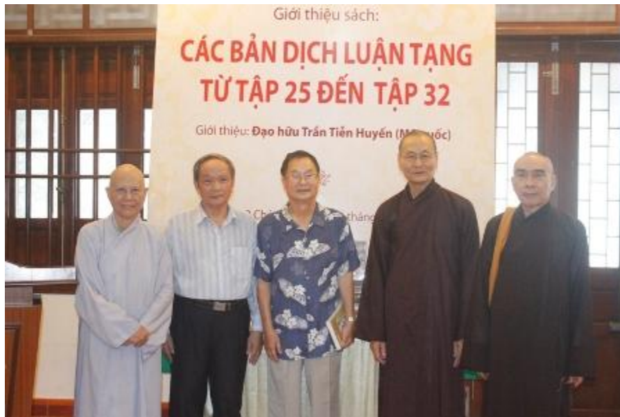
Tin - ảnh Liễu Quán - Huế